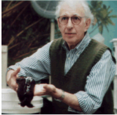
Prof. Kandel zeigt einer Aplysia die Nachricht vom Nobelpreis.

geb. 1929 in Wien (Autobiographie: http://www.nobel.se/medicine/laureates/2000/kandel-autobio.html ) ist seit 1974 Prof. am Center for Neurobiology and Behavior und seit 1984 Senior Investigator am Howard Hughes Medical Institute der Columbia University NY. Kandel befasst sich seit 26 Jahren mit der bescheidenen aber lernfähigen Intelligenz von Aplysia . Er ist Mitgründer der Firma Memory Pharmaceuticals (mit Hoffmann-LaRoche) und erforscht ca. 200 bekannte Wirkstoffe, so genannten "cognitive enhancers" mit denen man Lernen und Gedächtnis von Tieren und Menschen beeinflussen kann. Er gilt als der Entdecker der zentralen Rolle der Creb-Proteine im Lernvorgang. Er teilt sich mit den Neurowissenschaftlern Arvid Carlsson, Göteborg (Rolle des Dopamins) und Paul Greengard, New York (Rolle der Phosphorylierung) den Nobelpreis für Medizin 2000 (Zitat aus der Nobel-Laudatio: "for their discoveries concerning signal transduction in the nervous system"). Kandel ist Mitglied der Berlin-Brandenburgischen Akademie der Wissenschaften www.bbaw.de .